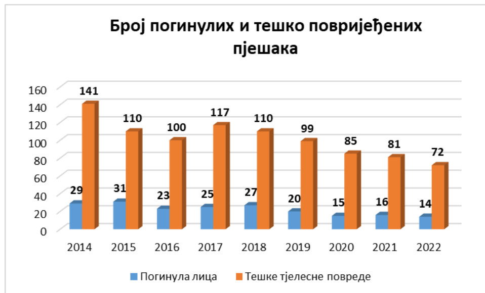
Дијаграм бр. 1. Приказ броја погинулих и тешко повријеђених лица

На дијаграму бр. 2. дат је приказ процентуалног учешћа погинулих и тешко повријеђених пјешака у односу на укупан број погинулих и тешко повријеђених лица. Може се закључити да се учешће погинулих пјешака смањило за 2%, а проценат тешко повријеђених лица је остао исти у односу на претходну годину.