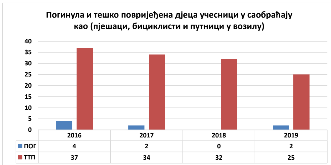
Дијаграм 1. Погинула и тешко повријеђена дјеца учесници у саобраћају (пјешаци, бициклисти и путници у возилу)

На дијаграму 1. је приказан укупан број погинуле и тешко повријеђене дјеце у саобраћају који учествују у саобраћају као пјешаци, бициклисти и путници у возилу за претходне четири године. Укупно је погинуло 6 дјеце од 2016. године до 2018. године, док је у 2019. години било двоје погинуло дијете (а учествовало је као пјешак у саобраћају и путник у возилу). Број тешко повријеђене дјеце није константан и из године у годину варира, док је знатан пад забиљежен у 2019. години.