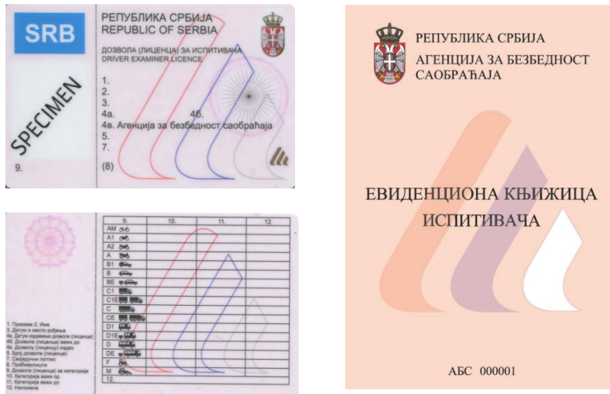
Слика 5. Изглед лиценце и евиденционе књижице испитивача

И код ових кадрова остаје иста примедба која је изнета код инструктора вожње, а односи се на дела за која ова лица не смеју бити кажњавања или да се не води поступак.