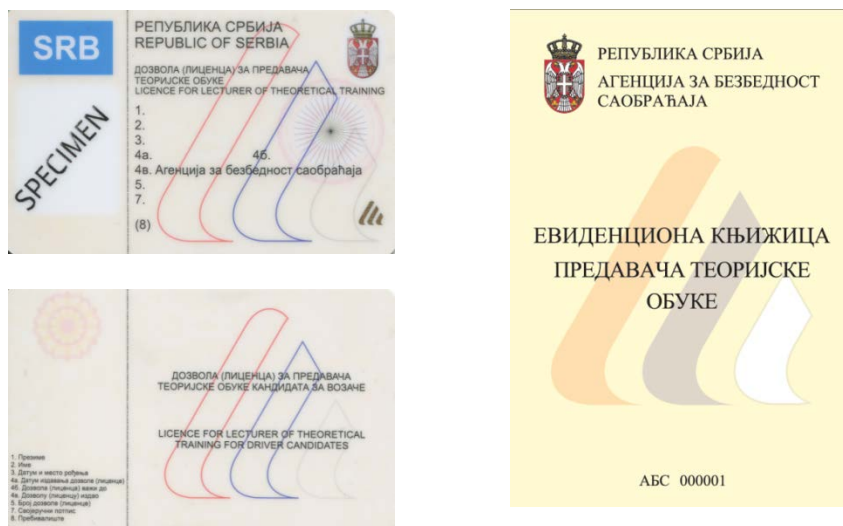
Слика 3. Изглед лиценце и евиденционе књижице предавача теоријске обуке

Након обављених припрема, које су подразумевале, припремање одговарајуће литературе, одабир просторија и ангажовање лица којима је Агенција током 2011.године издала „нулте“ и „прве“ лиценце, Агенција је од 07. априла 2013. године почела са организовањем припремних настава за предаваче теоријске обуке, а од јула 2013.године са спровођењем стручног испита за предавача теоријске обуке.