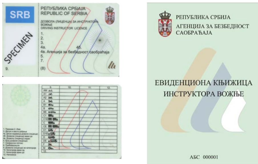
Слика 1. Изглед лиценце и евиденционе књижице инструктора возње