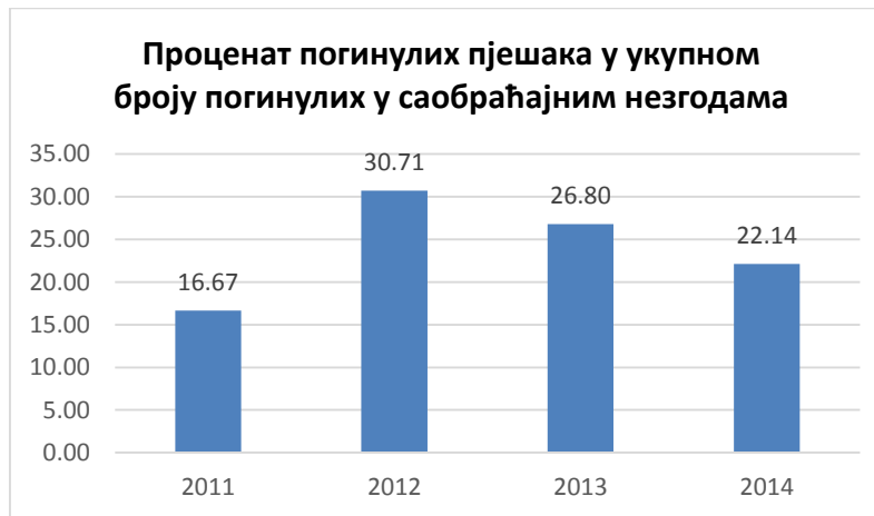
Дијаграм бр. 3. Процент погинулих пјешака у укупном броју погинулих у саобраћајним незгодама у Републици Српској

У саобраћајним незгодама у Републици Српској у 2014. години смртно је страдало 29 пјешака. У односу на 2013. годину, смањен је број смртно страдалих пјешака за 29.3%. Према подацима МУП-а РС, кад је у питању старосна доб погинулих, највише погинулих је старије од 60 година. Скоро све незгоде догодиле су се у ноћним условима одвијања саобраћаја (већина незгода између 16 часова и 22 часа), ван насеља, на отвореном и неосвијетљеном дијелу пута.