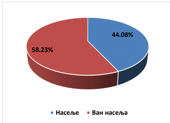
Дијаграм бр. 2. Истраживање брзине кретања моторних возила на путевима Републике Српске

Највеће непоштивање ограничења брзине код возача забиљежено је на дионицама путева ван насеља, гдје је ограничење брзине 60 km/h. На основу резултата истраживања уочено је да брзина кретања возила у дневним условима одвијања саобраћаја мања на локацијама у насељу и аутопуту односу на ноћне услове вожње на истим локацијама ( Мјерење брзине кретања моторних возила на путевима Републике Српске у току 2016. године, посјећено дана 21. маја, 2018. године, http://www.ams-rs.com/preventiva/istrazivanje/brzina ).